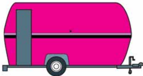
une caravane ou un fourgon sont parfaits pour réaliser un sténopé mobile.