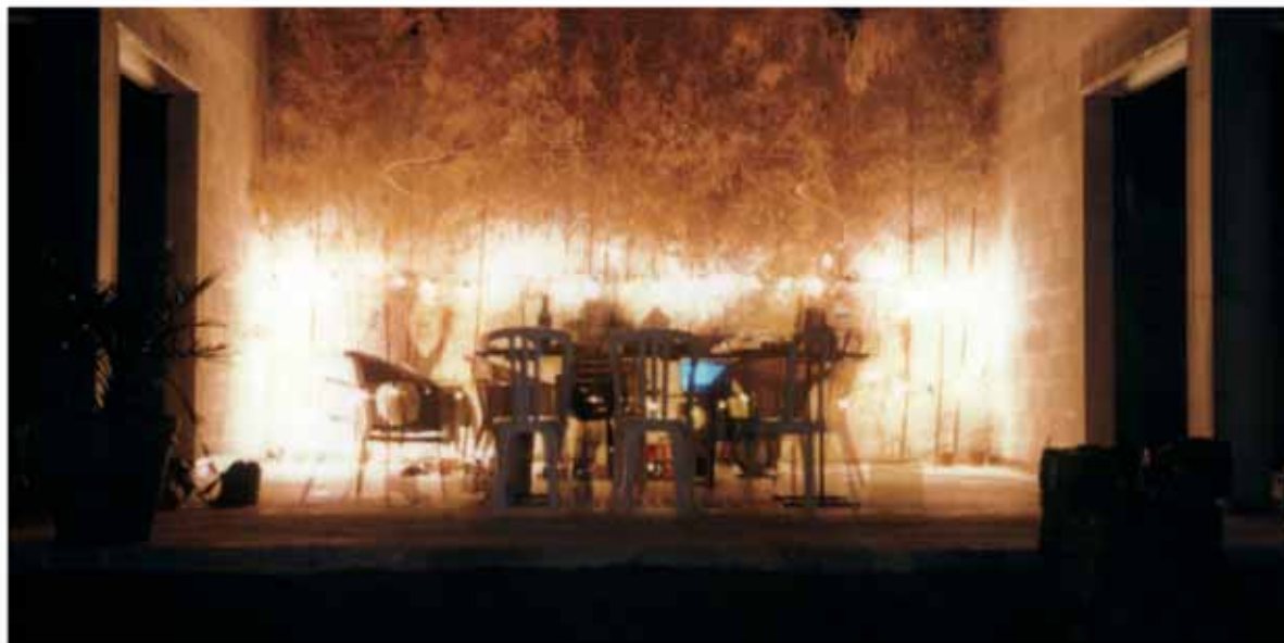
dîner d'artistes à la galerie 22

S'il est difficile de dire ce qu'est l'art - au-delà de ses composantes que sont la technique, le talent et l'esthétique comme définit dans les dictionnaires usuels - les dîners d'art ont pour ambition de proposer une rencontre avec ceux qui font, animent l'art. En premier lieu, les artistes.