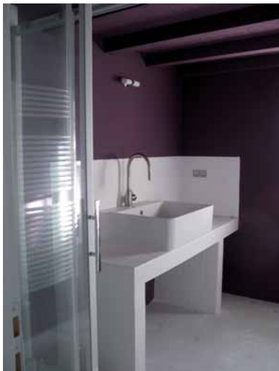
la salle de bain

Parmi les éléments de travail un four à céramique à gaz* de grande capacité et une table de travail de la terre sont disponibles sous conditions.